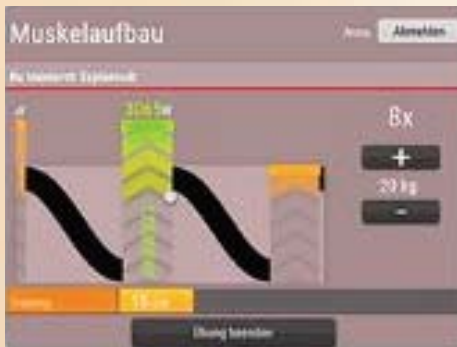
Die ideale Trainingsergänzung - eGym Premium

Ebenfalls seit einigen Wochen ist unsere neue Trainingsoberfläche an den eGym-Geräten aktiv. Diese sieht nicht nur besser und übersichtlicher aus, sondern bietet noch mehr Sicherheit zur richtigen Ausführung beim Training. Deutlich größere "Wellen" sowie eine angenehmere Farbe machen dein Training jetzt noch genauer. Die zusätzlich in den Kurven hinterlegten Punkte (Anmerkung: Man fühlt sich fast in Pacmans Zeiten zurückversetzt) bringen Dir den Vorteil, dass wenn Du diese triffst, noch effektiver und genauer trainierst. Besonders der "untere Punkt" sollte mittig getroffen werden, denn dann ist sichergestellt, dass Du das Gewicht nicht für einen kurzen Moment absetzt, sondern deinen Muskel weiterhin unter Spannung hältst.